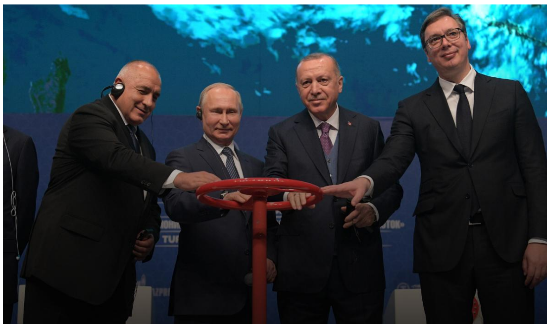
Az átadás: Bolgár és a szerb miniszterelnök, az orosz és a török elnök.

Az új szakasz 2021-es átadásával nagyon közel került Oroszország ahhoz, hogy befejezze az Ukrajnát elkerülő, és az egész térséget bekerítő, gázvezetésekből épülő gyűrűt. (Ennek a gyűrűnek a megépítése ellen küzdött az EU és az USA - hiába.)