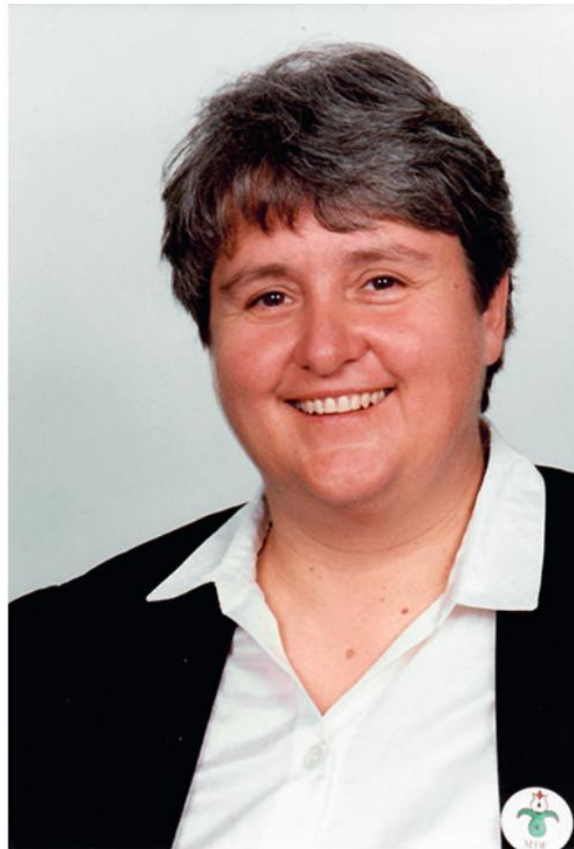
Az MDF képviselői fotó