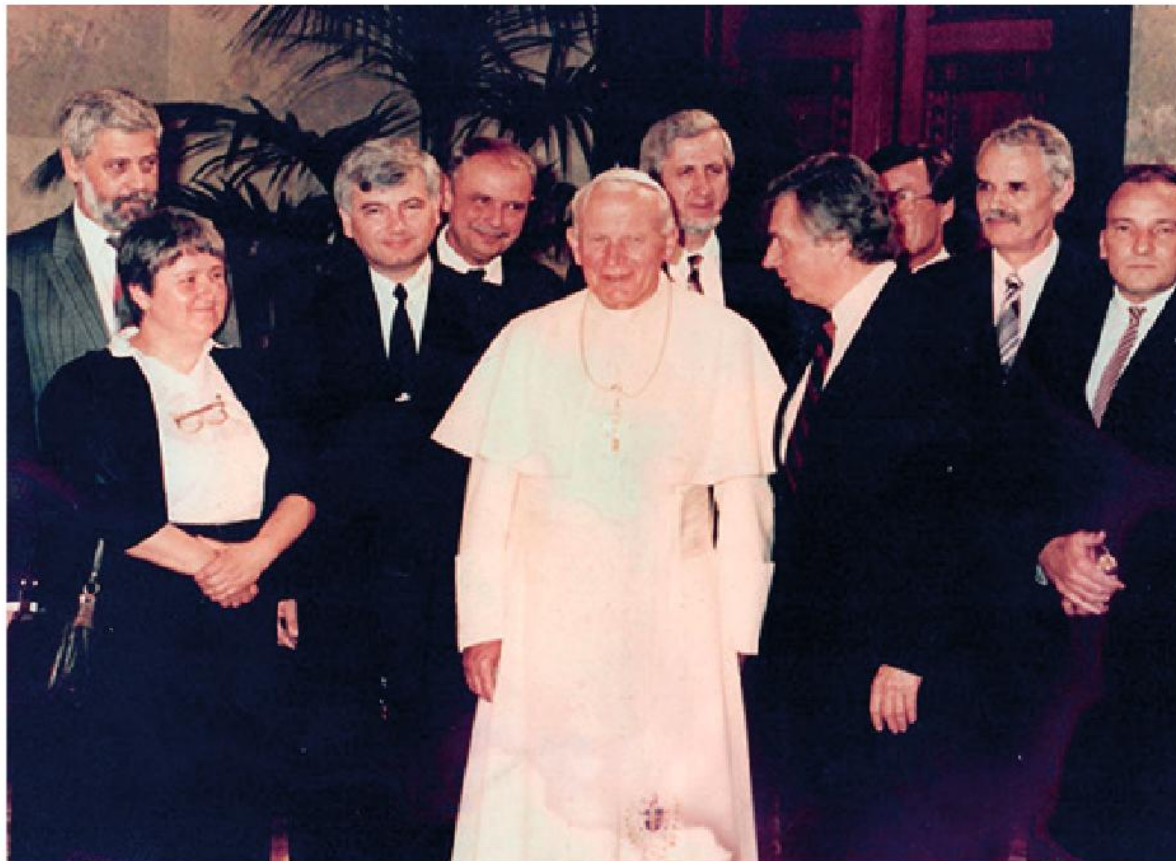
II. János Pál pápa látogatása a Parlamentben